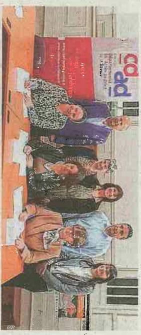
Avec la convention du point-justice jeunes, les moins de 25 ans auront accès à des consultations juridiques.

Lundi 15 mai, la convention du point-justice jeunes a été signée. Ce dispositif gratuit, basé à la Maison de la justice et du droit (MJD), bénéficie aux moins de 25 ans l'accès à ces principes. Rendre accessible le droit pour les moins de 25 ans avec des consultations juridiques gratuites, tel est l'objectif du nouveau point-justice ouvert à Saint-Jean-de-Maurienne. Ce nouvel élément de l'accès au droit a fait l'objet d'une convention signée ce lundi 15 mai, au sein de la Maison de la justice et du droit. C'est dans ce lieu qu'est basé ce point-justice jeunes.