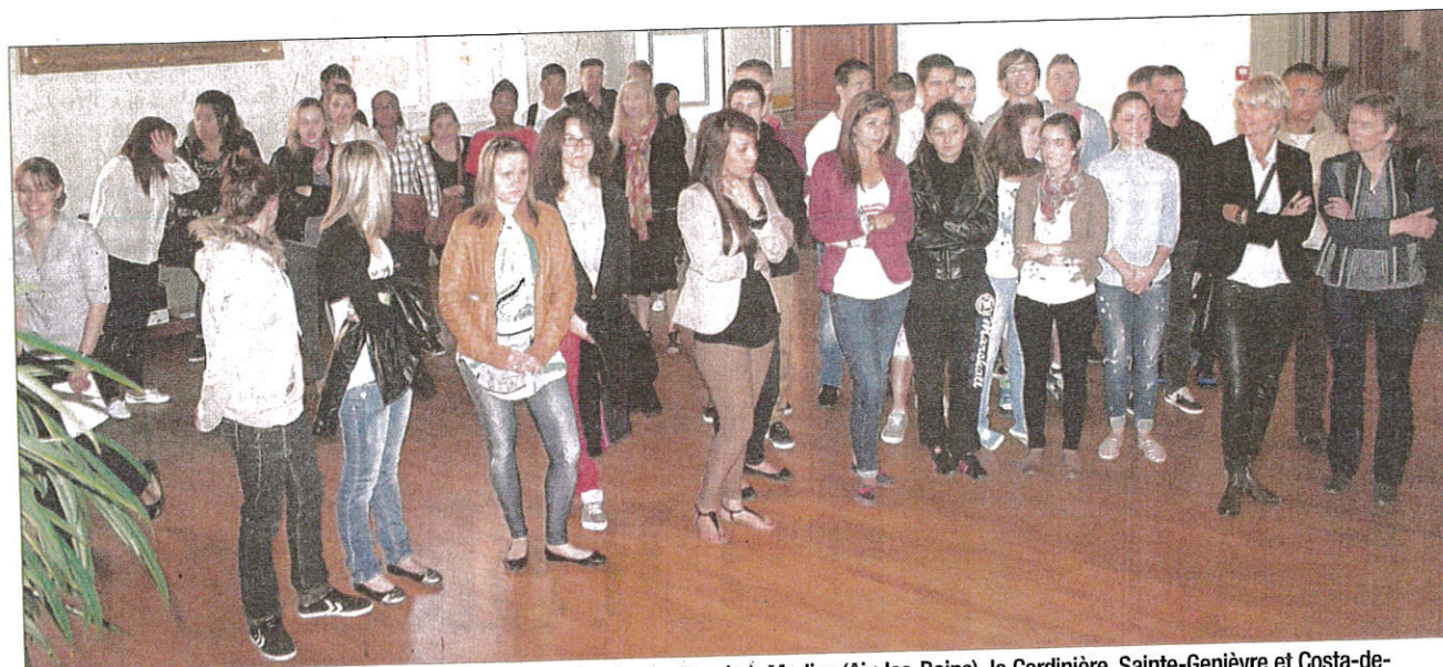
Des élèves fréquentant les lycées de Challes-les-Eaux, du Granier (La Ravoire), Marlioz (Aix-les-Bains), la Cardinière, Sainte-Genièvre et Costa-de-Beauregard (Chambéry), ont visité le palais de justice, mardi.